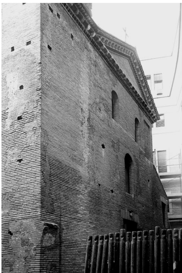
481. Rom, S. Lorenzo in Piscibus, Fassade heutiger Zustand

hochmittelalterlich und hat ein Modul von 30 cm (Abb. 481) 22 . Es trägt Spuren einer groben Abarbeitung für den späteren Verputz. Ein vermauertes neuzeitliches Fenster (eventuell auch eine Tür?) auf der rechten Fassadenseite deutet ebenfalls darauf hin, dass hier originale Bausubstanz erhalten ist. Ob die heutige Anordnung der Rundbogenfenster – zwei auf der Höhe der Obergadenfenster und in gleicher Größe wie diese und darunter ein weiteres Fenster auf der Mittelachse – auf einem archäologischen Befund basiert, ist nicht zu klären, da das Mauerwerk, das die Fenster umgibt, erneuert ist.