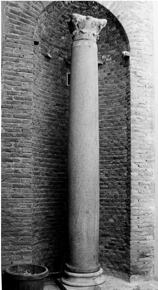
485. Rom, S. Lorenzo in Piscibus, entfernte Langhaussäule mit Kapitell, ehemals unter der Südwest-Ecke des Glockenturms.