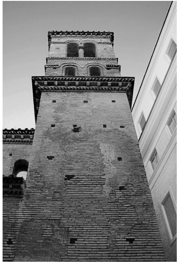
486. Rom, S. Lorenzo in Piscibus, Glockenturm des 12. Jahrhunderts

die zierlichen doppelten Blendbögen der Bifore eingesetzt. Das Kranzgesims setzt sich aus einer einfachen, die Richtung wechselnden Sägezahnreihe mit darüber liegenden Marmorkonsolen zusammen. Das oberste Geschoß ist auf allen drei (sichtbaren) Seiten mit dunkelgrünen Keramikbecken geschmückt, je eines auf mittlerer Eckpfeilerhöhe und drei im Arkadenbereich. Der Keramikschmuck lässt sich auch auf Fotos aus der Zeit vor der Restaurierung nachweisen und ist original.