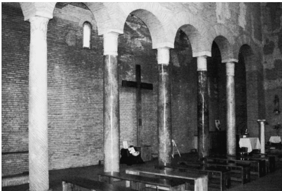
484. Rom, S. Lorenzo in Piscibus, östliche Mittelschiffarkaden