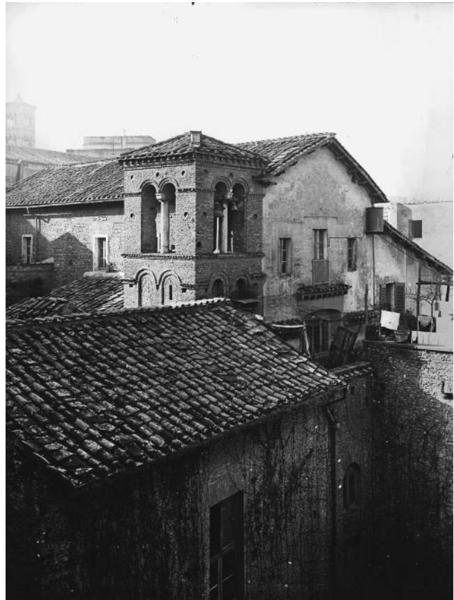
480. Rom, S. Lorenzo in Piscibus, Fassade und Glockenturm vor der Restaurierung von 1940–1950

die ohne Aufsicht der staatlichen Soprintendenza durchgeführt wurde, ist mir keine Dokumentation bekannt. Im Archiv der Kirche ist eine anonyme Abhandlung erhalten, die einige Informationen zur Restaurierung enthält, die möglicherweise auf mündliche Aussagen des verantwortlichen Architekten Adriano Prandi zurückgehen. 19 Die Kirche wurde erst nach einem erneuten Umbau 1982 wieder dem Kult übergeben. 20