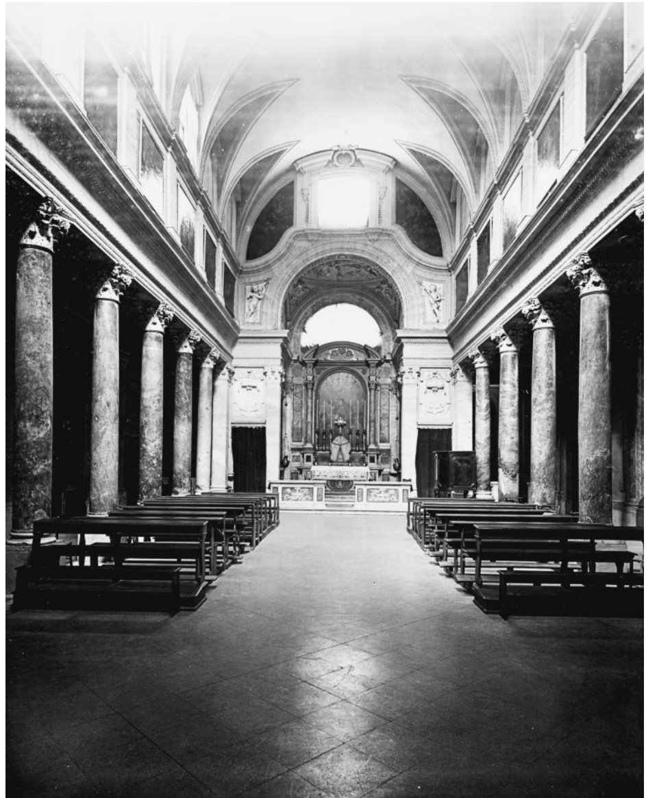
482. S. Lorenzo in Piscibus, Langhaus vor der Restaurierung von 1940–1950

Disposition mit der höheren und entsprechend im Schaft etwas kräftigeren Säule unter der Südwest-Ecke des Turmes für mittelalterlich. 27 Einzig das korinthische Kapitell dieser ausrangierten Säule ist erhalten; es handelt sich um eine spätantike Spolie (Abb. 485) nicht besonders feiner Ausarbeitung. 28 Von den restlichen 11 Kapitellen ist wenig übrig geblieben (Abb. 484). Der purifizierende Restaurierungsimpetus machte offensichtlich auch dann nicht halt, als man feststellte, dass unter dem barocken Stuck die wohl antiken Kapitelle abgeschlagen worden waren. Die Säulenschäfte bekrönen heute ebenso schmale, grob behauene Marmorzylinder, die, wie abgenagt, ein ziemlich trauriges Bild geben.